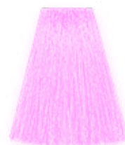
БАББЛ ГАМ 6710