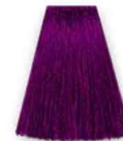
ТЁМНО- БАКЛАЖАНОВЫЙ 8411